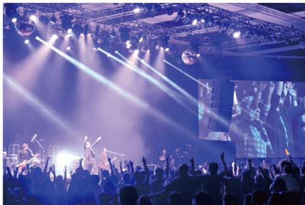
東京スカパラダイスオーケストラ JAPAN NIGHT in Jakarta @ The Kasablanka 2015年4月4日

・アニメなど過去の 映像作品のアーカイブを整備し、 訪問者が自由に閲覧できる 拠点を構築 (竹芝地区の国家戦略特区を活用)